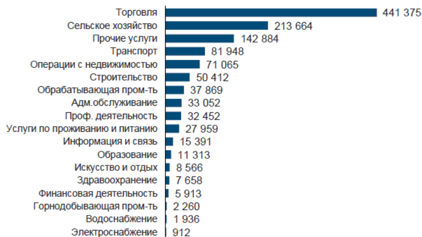
Рисунок 2. Действующие субъекты МСП по отраслям на 1 января 2017 года.

По данным Национального доклада о развитии предпринимательской активности в Республике Казахстан за 2016 г., подготовленного Национальной палатой предпринимателей РК «Атамекен», 99,8% всех предпринимателей относятся к субъектам малого и среднего бизнеса.